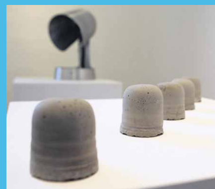
Nicht abbeißen. Schokoküsse aus Beton. Spitze sitzen. Ein ungewöhnlicher Hocker.